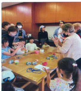
なつかし遊び あやとり