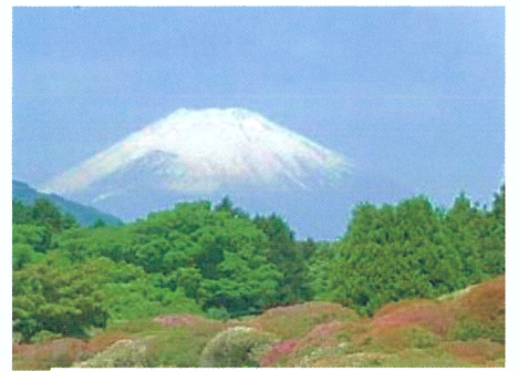
山のホテルより富士山を望む