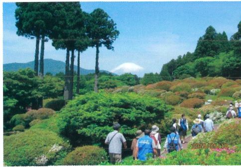
山のホテル 庭園散策