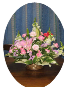
監事 目黒 測