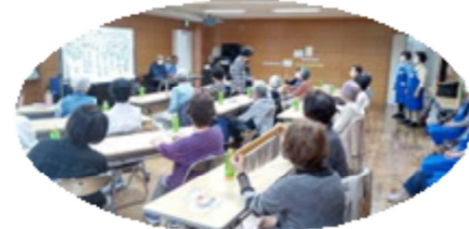
令和5年度は月2回第2、第4金曜日の「ふれあい広場(お楽しみ会)」