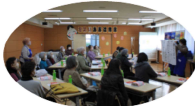
1月「ふれあい広場(新年会)」