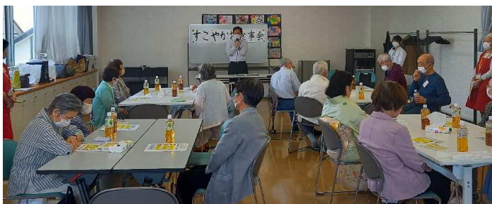
青葉警察より特殊詐欺の講話