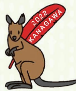
共同募金 PR 大使 オグロワビー 「オハナ」

赤い羽根募金、年末たすけあい募金、日本赤十字募金に、ご協力ありがとうございました。お寄せいただきました募金は、区内の福祉保健活動団体への助成等や日本赤十字社の活動に役立たせていただきます。