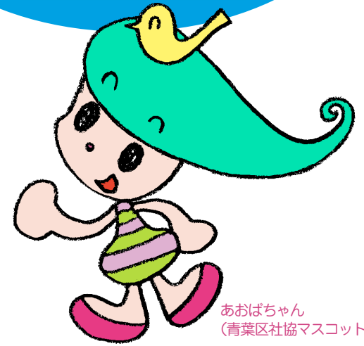
あおばちゃん (青葉区社協マスコット)